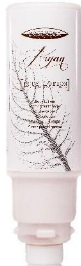
BODY LOTION Sweet Argan