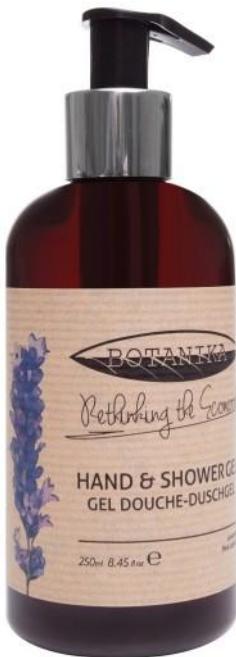
HAND AND SHOWER GEL Lavender