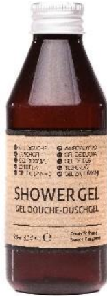
SHOWER GEL Verbena and Bergamot