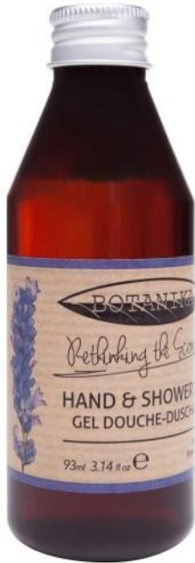
HAND AND SHOWER GEL Lavender