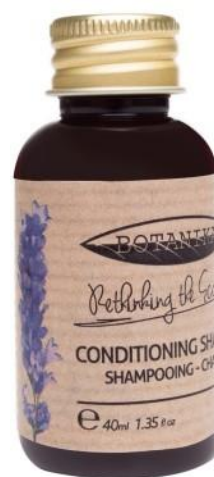
CONDITIONING SHAMPOO Lavender