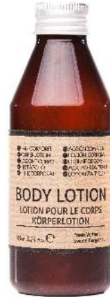
BODY LOTION Sweet Argan