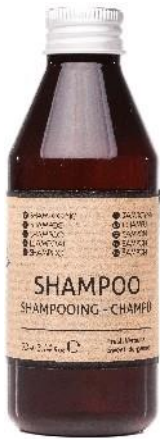
SHAMPOO Verbena and Bergamot