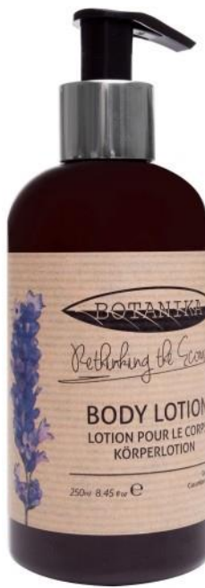
BODY LOTION Green Tea enriched with Cucumber fragrance