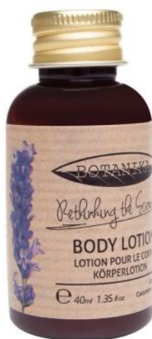
BODY LOTION Green Tea enriched with Cucumber fragrance