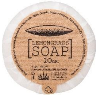
VEGETABLE SOAP Lemongrass