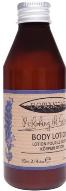
BODY LOTION Green Tea enriched with Cucumber fragrance