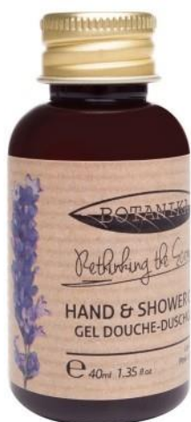
HAND AND SHOWER GEL Lavender