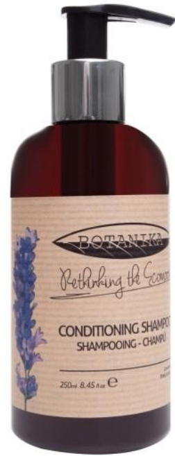
CONDITIONING SHAMPOO Lavender