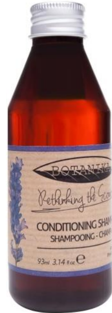
CONDITIONING SHAMPOO Lavender