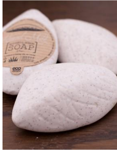
VEGETABLE SOAP - SPA STONE Almond milk and Nutshell Scrub