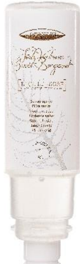
LIQUID SOAP Verbena and Bergamot