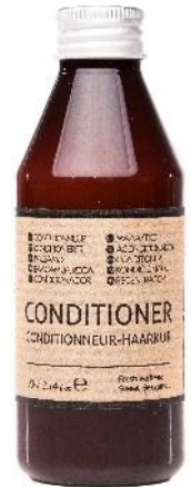
CONDITIONER Jasmine and Orange